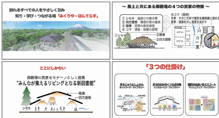
令和3年7月～ 設計プロポーザル

御殿場の民家の特徴を活かし、訪れるすべての人をやさしく包み、知り・学び・つながる場「みくりや・ほんてらす」