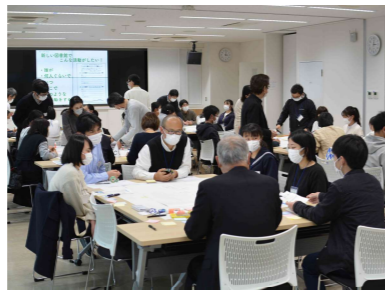
グループワークで活発に意見交換