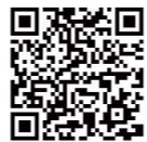
設計プロポーザル の実施(結果公表)