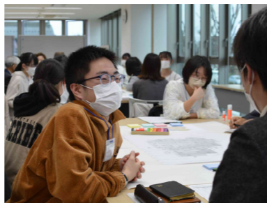
初対面でもアイスブレイクで和む