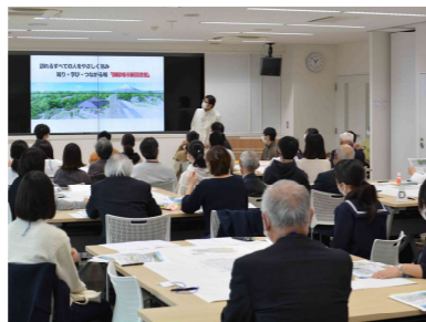
設計者からプロポーザル案の説明