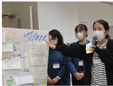
参加者全員で共有するために発表