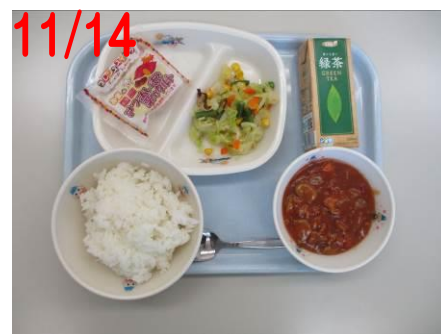
ごてんぼこめこハヤシ