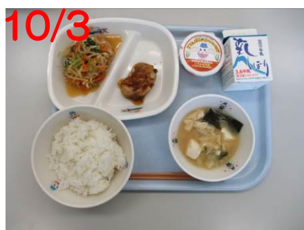
ごてんぼの日 記念給食