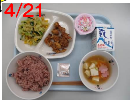
入学・進級お祝い献立