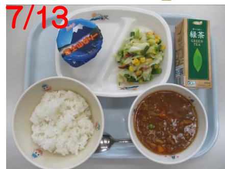
ごてんぼこめこカレー