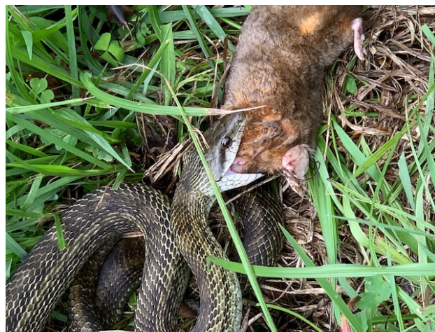
竈もちやまの里遊歩道でモグラを捕食するアオダイショウ