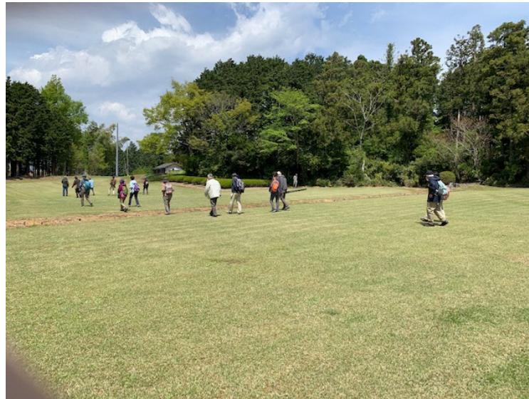
竈もちやまの里調査風景