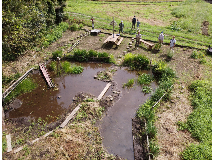
竈、もちやまの里のトンボ・ドジョウの池