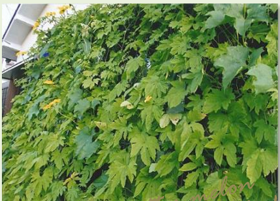
Bitter melon Luffa

年中児が担当となって進んで水やりをしていました。花を色水遊びに使用したり、涼んだり楽しむ姿が見られました。