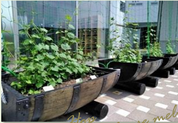
Hop Mouse melon