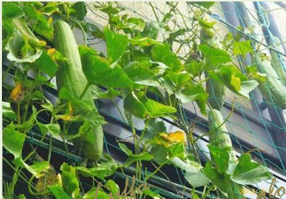
Luffa Morning glory

花が咲き実になっていくなど日々の水やりの際に見られる生長や生命力の強さを観察することができました。