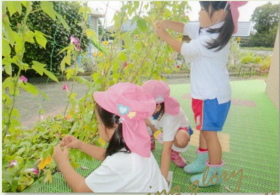
Morning glory Balloon vine