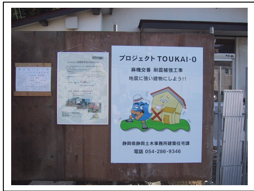
見学会の案内看板