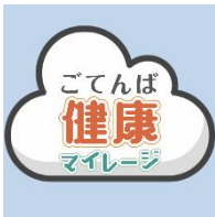
※アプリアイコンイメージ