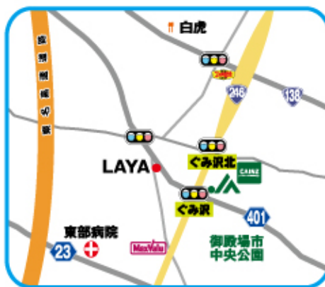
「くみ沢バス停」より 徒歩3分