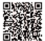
アクセスはこちら！

※必ずしも障害者手帳をお持ちであることが条件ではありません。お気軽にご相談ください。