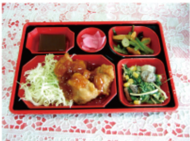
鶏の甘酢あんかけ弁当