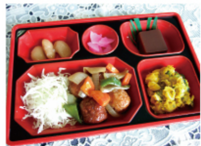
中華風肉団子弁当