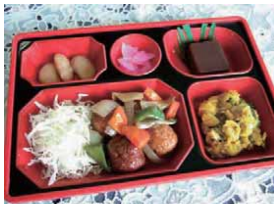
中華風肉団子弁当