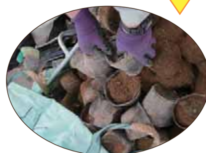
ポットの土を出します