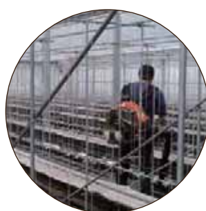
プロアーをかけます