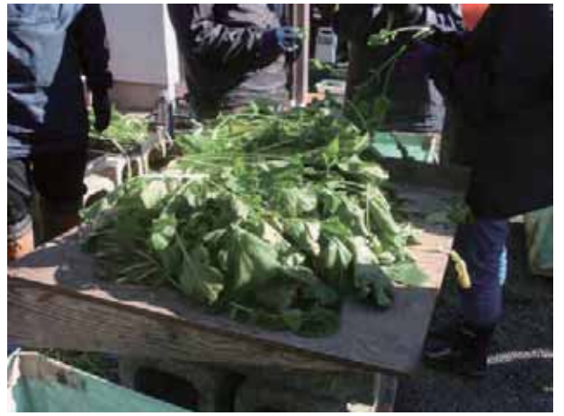
収穫した水かけ菜を仕分けしています