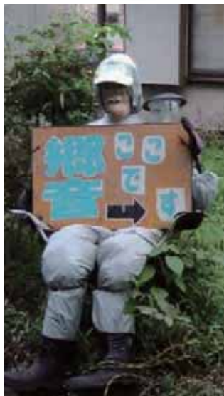
かかしの作成もしています