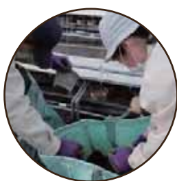
ポットを集めます