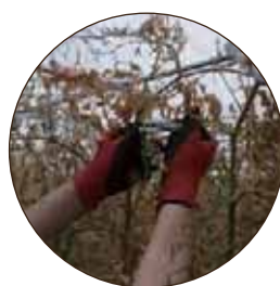
クリップを外します