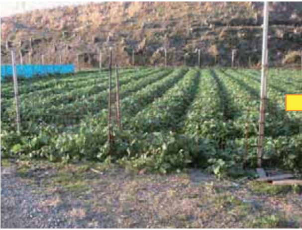
水かけ菜はこの田んぼで育てています