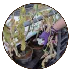
ハサミで枝を切ります