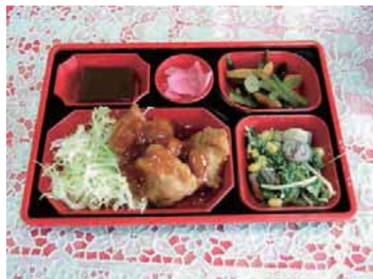
鶏の甘酢あんかけ弁当