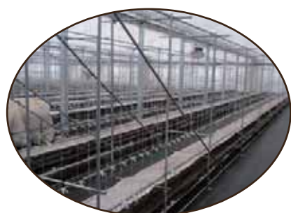
作業が終わると、こうなります