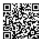
御殿場市ホームページ 各種検診