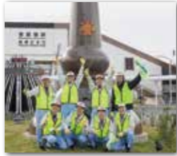
▲ボランティアメンバー