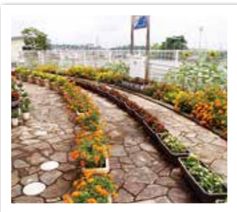
▲学校の部 印野小学校