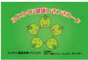
▲ふじのくに健康いきいきカード