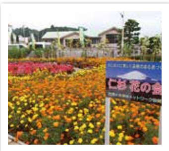
▲団体の部 仁杉区 花の会