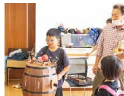
▲廃材で作られたおもちゃ