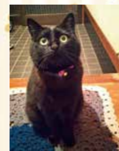
クマ 女の子 ミックス