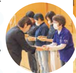
▲長年の功労者に記念品を贈呈。