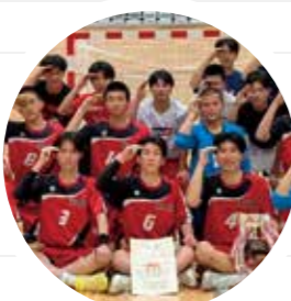
▲部活の メンバーと

現在、男子ハンドボール部の副キャプテンをしており、全国大会での1勝を目標に日々練習に励んでいます。高校生活集大成となる今年、目標を達成し、将来の夢を叶えるための弾みを付けたいです。