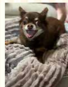
がく 男の子 チワワ