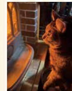
つき 男の子 キジトラ

掲載するペットを募集しています。大切な家族の一員を、広報でごんばに掲載しませんか?