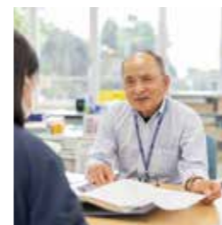
▲ふじぎくらの市民活動室内で活動中

ボランティアをする上での一番の喜びは、人との出会いです。色々な人の話が聞け、こんなに良い世界はないと感じています。たくさんの人の「ありがとう」がパワーになります。興味があったら、ぜひ遊びに来てください。