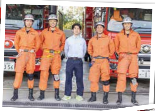
▲▼御殿場消防署で、 現役の消防士と 対面。消防車や 救急車の案内を 受けた。