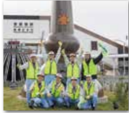
▲ボランティアメンバー