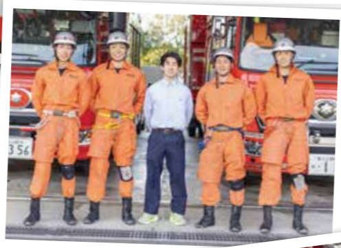
▲▼御殿場消防署で、 現役の消防士と 対面。消防車や 救急車の案内を 受けた。