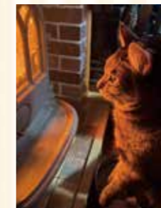
つき 男の子 キジトラ

掲載するペットを募集しています。大切な家族の一員を、広報でごんばに掲載しませんか?