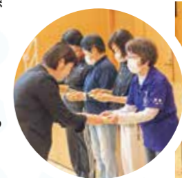
▲長年の功労者に記念品を贈呈。