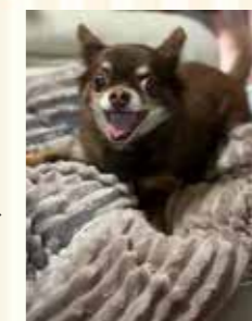
がく 男の子 チワワ