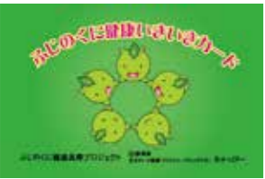
▲ふじのくに健康いきいきカード