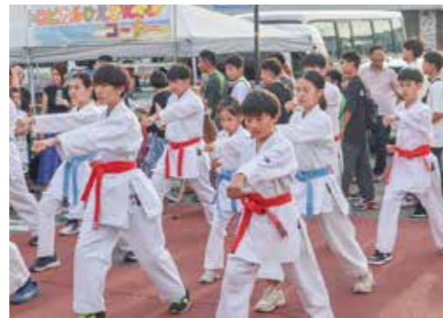
◀御殿場夏祭りでの演武