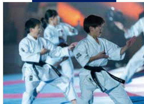
◀全国からトップクラスの高校生が集結する大会「空手道 マウントフジ ジュニアチャンピオンシップ in 御殿場 (KMFC)」での演武