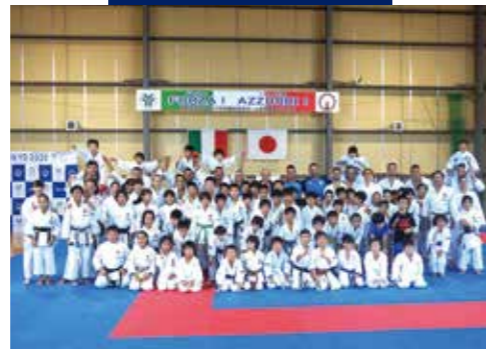
◀東京2020大会を契機としたイタリア代表との交流