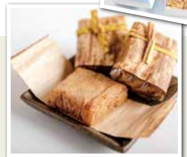
河内屋菓子店 みやまし強力餅

かつて御殿場には、多くの強力 ごうりき 達がありました。強力とは富士山頂に荷物を歩いて背負いあげる人です。お腹のすく重労働で、大きなお弁当の他に彼らのポケットにはいつも硬くならない砂糖餅とクルミが入っていました。 この二つを合体させ、黒糖・醤油・みりんを味を整え、ニツキ風味のきなこをまぶしたのが強力餅です。モチモチ食感とクルミのアクセントが好評です。 「みやまし」とは御殿場の方言で働き者のこと。「人生の重荷を背負いて」目標を目指す現代のがんばりやさんへのエールの意味も込めました。 登山にも、勉強や仕事の疲労回復にも役立てていただけなら幸いです。