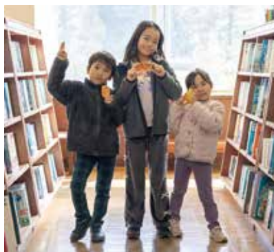
▲図書館への感謝の思いを書いてくれた子どもたち