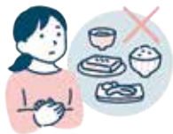
特定健診における地区別朝食欠食状況

県平均と比較（朝食を食べていないと答えた人が多いほど濃いピンク色、少ないほど濃い青色）した結果、高根地区（女性）を除き朝食を食べていない人が多いことがわかりました。中には県平均の1.5倍も多い地区もありました。