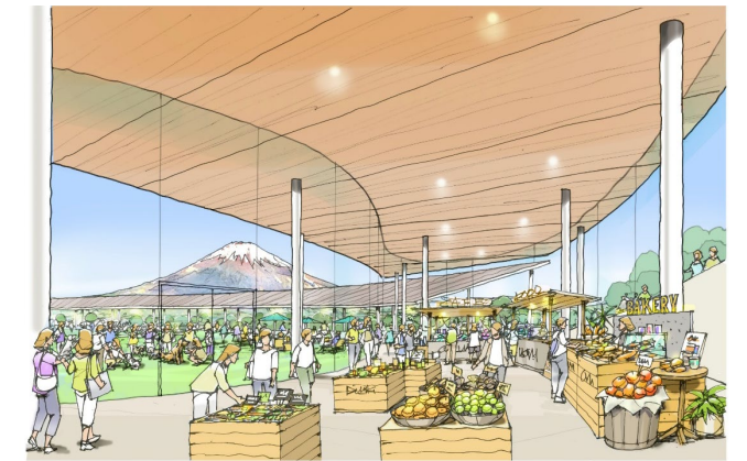
建物と広場のイメージ