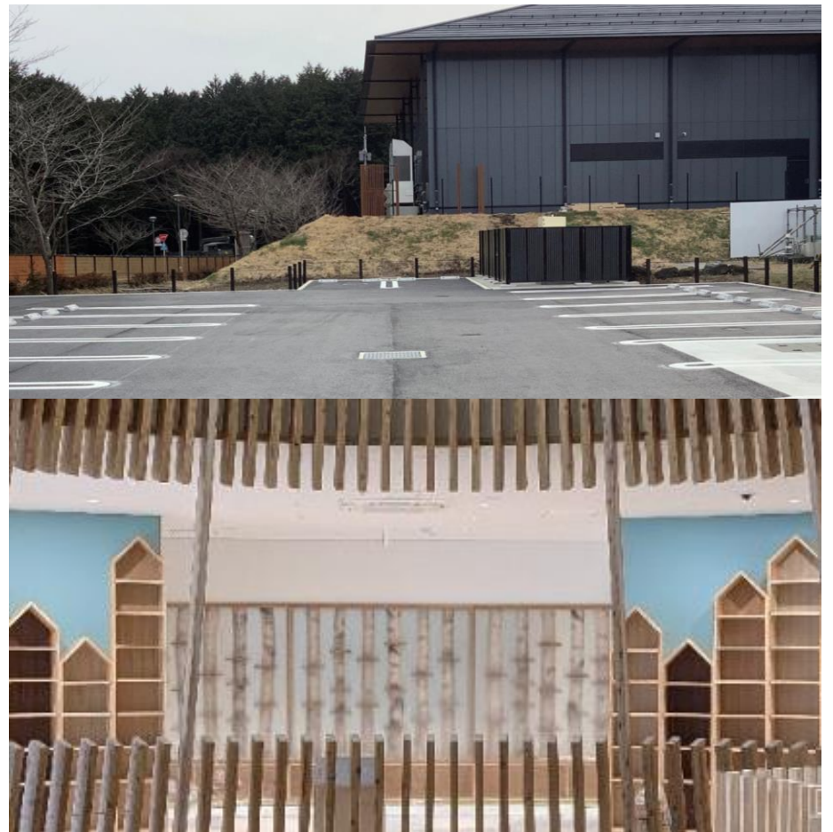
2階 富士のもりひろば

樹空の森 屋外遊具側の駐車場が完成しました。今後、外構、看板など屋外施設の整備が進んでいきます。一方、館内では造作棚の据え付けなど、完成に向け、順調に整備されています。