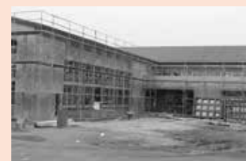
建設中の現図書館(昭和55年頃)