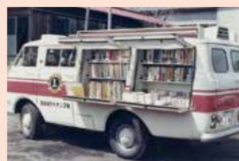
初代・移動図書館車ライオンズ号

図書館の館内書架などに、昔の写真を展示しています。当時の図書館やライオンズ号の様子が分かります。