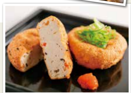
焼いて食べる厚揚げ 焼いて食べるがんもどき