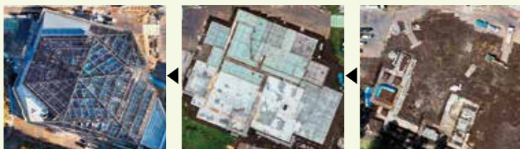
③令和7年2月 ②令和6年9月 ①令和6年4月