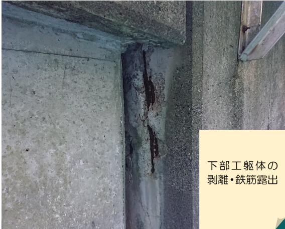
永尾大橋修繕（2018年度）