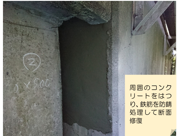
森之腰橋修繕（2018～2019年度）