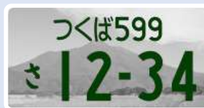
寄付金なし(モノトーン)