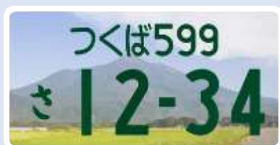
寄付金あり(フルカラー)