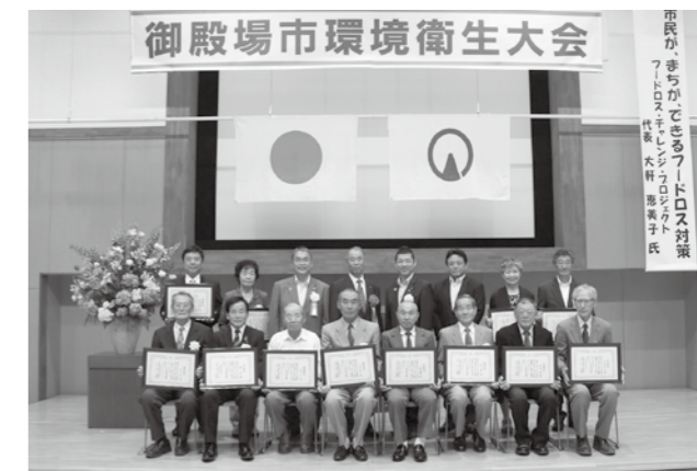
多くの皆さんが表彰されました

第52回御殿場市環境衛生大会が市民交流センターふじざくらで開催されました。 大会の中では、環境衛生功労者の表彰が行われ、長年にわたり環境衛生に貢献した個人9人、5団体が表彰されました。また、第2部の記念講演ではフードロスに関する講演が行われました。 大会終了後、ごみ減量月間に合わせてマイバッグ持参率の向上を図るため、市内スーパーでごみ減量キャンペーンが行われました。ごみ減量大作戦実行委員会の委員が「ごみ減量にご協力ください」と呼びかけながら紙ひもを来店者に配布しました。