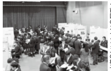
◀前回のガイダンスの様子