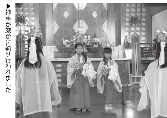
神事が厳かに執り行われました

新橋浅間神社で登山の安全を祈願し、夏山シーズンの開幕を告げる富士山開山式が行われました。 神事に先立ち行われた健脚祈願では、たくさんの三歳児が白装束に鉢巻き姿の可愛い姿で健脚を祈願していました。奉納花火に合わせてテープカットが行われた後、開山式神事が行われました。また、富岳太鼓による演奏や地元小学生による稚児舞も奉納されました。 併せてわらじ大祭のひとつである大わらじ奉納も行われ、夏のお祭りの成功を祈念しました。 御殿場の「暑い」夏が始まります！