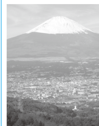
富士山眺望遺産 [乙女の鐘]