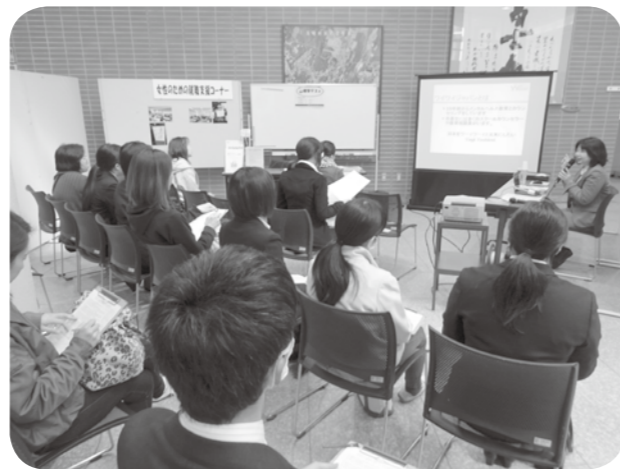
▲合同企業ガイダンスでは性格診断の心理テストを実施。高校生も参加してくれました。

男女共同参画講演会を11月25日(土)に開催します。くらしの安全課主催の人権講演会とタイアップして実施します。詳細については改めてお知らせします。