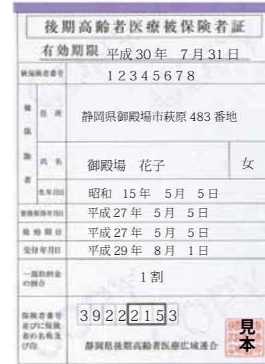
▶同封の新しい藤色の保険証をお使いください。

○年度途中で加入した場合は、月割りで計算します。 ※所得の低い人や健康保険組合などの被扶養者だった人には、保険料の軽減措置があります。