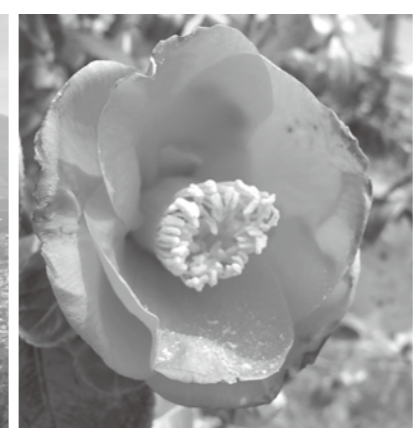
御殿場の[ヤブツバキ]