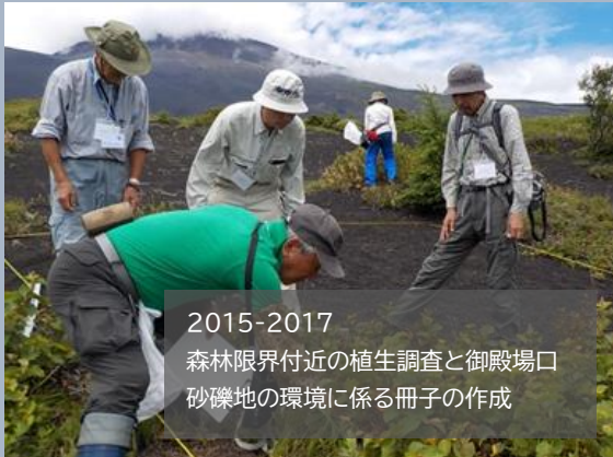
2015-2017 森林限界付近の植生調査と御殿場口 砂礫地の環境に係る冊子の作成