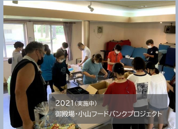
2021(実施中) 御殿場・小山フードバンクプロジェクト

御殿場市では、市民と行政が協力してまちづくりに取り組む事業を補助金で応援しています。 あなたの「こんなことを大切にしたい」という「まちづくり」への思いを実現してみませんか？