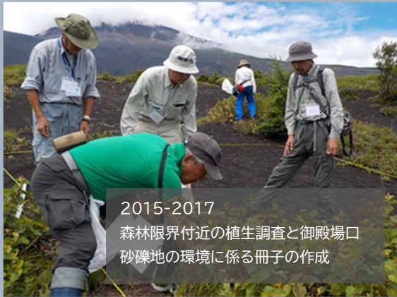
2015-2017 森林限界付近の植生調査と御殿場口 砂礫地の環境に係る冊子の作成