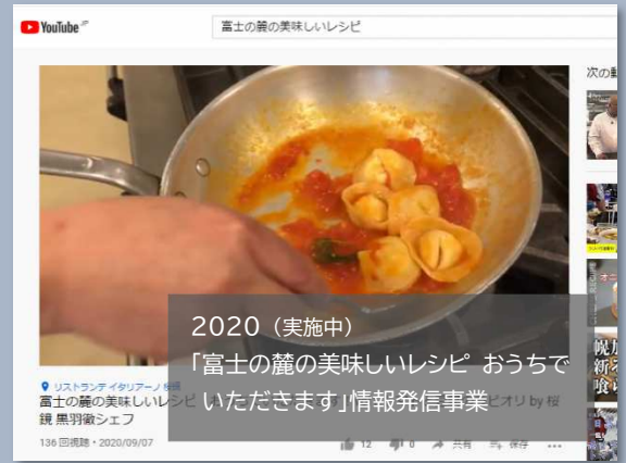
2020 (実施中) 「富士の麓の美味しいレシピ おうちで いただきます」情報発信事業 by 桜 黒羽織シェフ