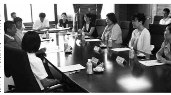
▶活発な意見交換がされた懇談会。様々な意見が出ました。

それにはインフラの整備が重要です。「横の道」は整備されていますが、「縦の道」の138号線は常に渋滞している道路ですので、バイパス化の重要性を国に訴えています。