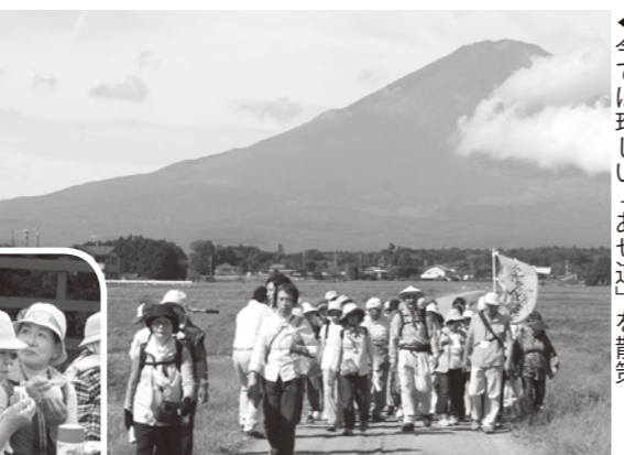
今では珍しい「あぜ道」を散策

富士の麓に広がる水田を歩く「御殿場こしひかりあぜみちウォーキング」が市内で開催されました。県内外から集まった参加者 50 人は、富士山とその裾野に広がる風景を楽しみました。ウォーキングの途中では、地元関係者や県の担当者からごてんばコシヒカリのおいしさの秘訣や、あぜ道に生える草花の説明等を参加者たちは熱心に聞き入っていました。お昼には、ごてんばコシヒカリのおにぎりを味わい「とてもおいしい」と大好評！御殿場の良さを多くの皆さんに知っていただくとても良い機会となりました。