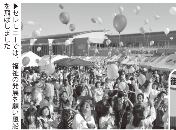
セレモニーでは、福祉の発展を願い風船を飛ばしました