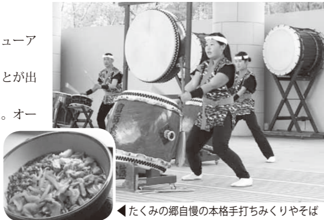
迫力ある太鼓演奏が観客を魅了

また、5月3日には富士山樹空の森で「子ども和太鼓まつり」が開催され、子どもたちで編成されている和太鼓チームなどが、元気いっぱいの姿を見せてくれました。