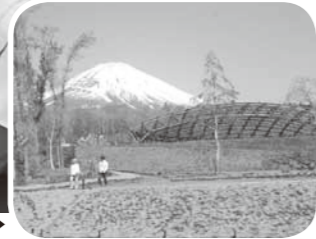
満開の芝桜が花を添えました

当日は8,800人の来場者で賑わい、見頃を迎えた芝桜にも多くの人が見入っていました。