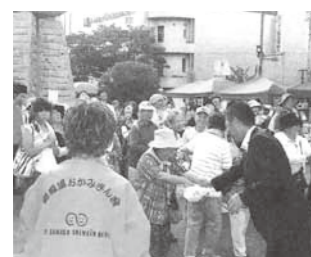
▲にぎわう駅前広場

地場産品や小物等の販売店、飲食店が30店舗、フリーマーケットが10店舗出店し、さらに9グループがステージを披露するなど、御殿場の夏を盛り上げました。