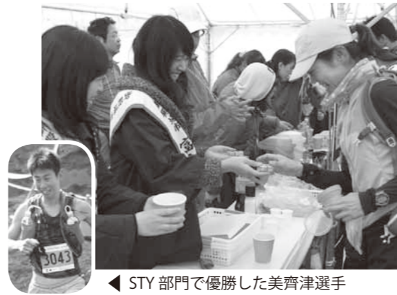
おもてなしに選手も笑顔に！

御殿場市でも富士山御殿場口太郎坊にエイドステーションを開設し、富士娘やボランティアの皆さんなどが御殿場名物でおもてなし。心温まるおもてなしと声援に、選手もつかの間の休息に笑顔を見せていました。