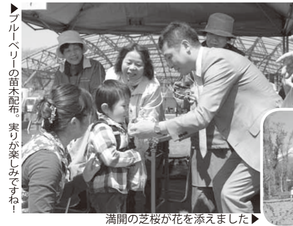
ブルーベリーの苗木配布。実りが楽しみです！