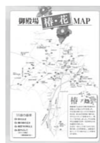
▲完成した椿マップ

江戸時代から御殿場の文化・生活に即した「椿」を御殿場の地域振興の足がかりとし、その素晴らしさを検証し、市民に広く伝える事業です。椿芸術祭、椿まつり、椿の挿し木会の開催・市内イベントへの参加、市内の椿マップの作製を行いました。