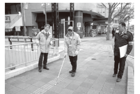
▲まち歩きによる現地点検