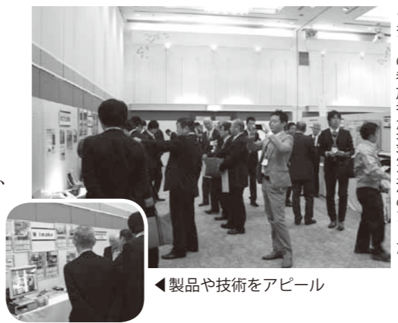
◀多くの参加者が交流を深めました

その後開催されたビジネス交流会では、16の企業・団体がブースを設けて、自社の製品や技術を展示・PRし、参加者も説明に熱心に耳を傾けたり、意見交換をしたりしていました。