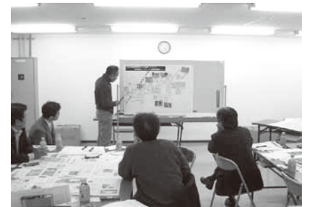
▲ワークショップによる課題等の話し合い