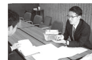
▲日々、緊張感を持って条例等の打ち合わせを行っています

がってきています。そのような状況の中、最近ではそれぞれの市の状況や市民の要望へ応えるために独自の条例を制定する市町村が全国的に増えてきました。市民の皆さんの要望を、市の行政に反映することができるようになってきているのです。これからの時代は、市民の皆さんの声をもとに市が作られていきます。思ったこと、感じたことはぜひ伝えてください。一緒に御殿場市を作っていきましょう!