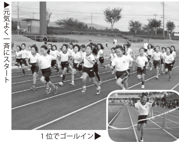
▶元氣よく一斉にスタート