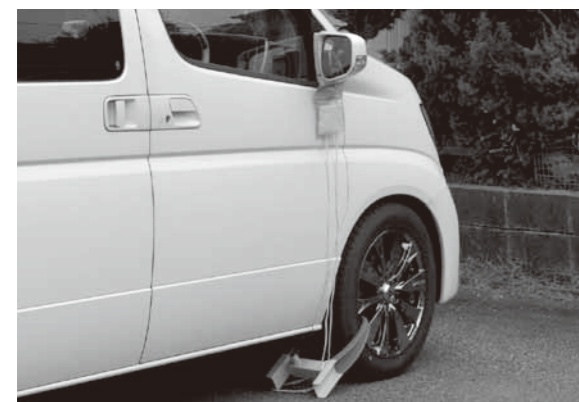
▲車の差し押さえの様子

徴収対策強化を実施 静岡県では個人住民税対策室を新設し、県全体で「徴収対策強化」・「滞納額の圧縮」を図っています。今年度は、さらなる徴収対策強化のため、個人住民税対策室から、職員が2人御殿場市へ派遣されます。 インターネット 公売を実施 滞納処分により差し押さえた物件について、ヤフー(株)を通じて、インターネット公売を実施しています。 HP http://koubai.auctions.yahoo.co.jp/