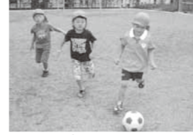
▲早く大きくなりたい!

たつし「先生って、どのくらい遠くまで蹴れるの?」 「園庭の半分くらいじゃない?」 「先生が園庭の端から端まで蹴って飛ばすよ」 たつし「すごい、なんでそんなに遠くまで蹴れるの?」 先生「大人になつたからかな」 たつし「うお!!早く大人になりたい!!」 「こはんいっぱい食べよつて!」