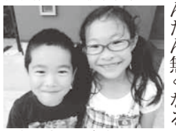
▲本を読むのがだいすき!

本を読むことはなくなった。毎晩布団で一緒に本をめくるこの時間も、だんだん無くなるのだろうか? 眠気に負け、私が何度か同じところを繰り返して読んで日、二人は「もう寝ていいよ。」と言ってくれた。(いやいやお母さんはもう少し罪滅ぼししないとね。)と思いつつ、次の瞬間、すんなり眠りに落ちていた。今週も図書館に通う。子どもと、自分のために。