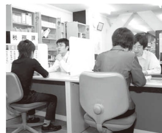
▲親切・丁寧な対応を心掛けています。

滞納整理の専門機関 「静岡県地方税滞納整理機構」 ●徴収困難案件について、滞納整理の専門機関である「静岡県地方税滞納整理機構」に移管することがあります。(平成23年度には、御殿場市から10件の滞納案件を移管し、納付約束を含め約900万円の徴収実績をあげています。) 納付方法について 市税は、コンビニエンスストア、市指定の金融機関、市役所各支所、駅前サービスセンター、市役所税務課窓口で納めることができます。 納付に関する問い合わせ／税務課 収納スタッフ ☎ (82) 4166 ◎市税の納付は、便利な口座振替をご利用ください 口座振替は、納期が来ると自動的にご自身の指定した預金口座から引き落とされるので、納め忘れがなくなり大変便利です。 ご自身の預金口座がある市指定の金融機関、郵便局または市役所税務課窓口で「口座振替依頼書」に必要な事項を記入・押印してお申し込みください。変更及び解約の手続きも同様となります。 口座振替に関する問い合わせ／税務課 管理・証明スタッフ ☎ (82) 4128