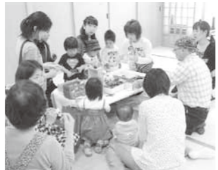
▲たくさんの人との交流が、子どもたちの心を育てます

を願っている地域の子育ての先輩と、同じ思いをしている子育ての仲間がいます。今、核家族で、両親以外の大人の人と接することが少ないお子さんもたくさんいると思います。子どもにとつて、温かい目で見られる大人の人と接することは、心の財産になります。同じ年頃の子どもを持つお母さんとのんびり過ごしてください。サロンでは、心を育てる木のおもちや、季節を感じる遊び、家庭にあるものでできる遊びなど、いくつかのコーナーも用意して待っています。