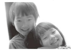
▲けんかもするけど、仲良い兄妹!

ことが面白くなかったのでも、少しホッとしたのを覚えていきます。子どもたちは小さいながらも兄妹愛というものを身につけていたようです。そんな微笑ましいひとときも一瞬で、また今日も2人で遊びとけんかを繰り返す毎日です。ただし、私たちは少し安心しながら見えています。