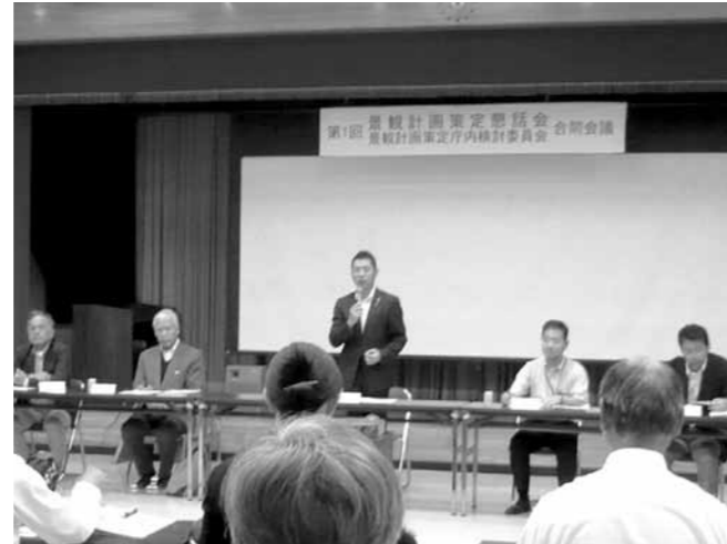
▲第1回景観計画策定懇話会の様子