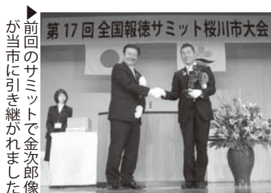
▶前回のサミットで金次郎像が当市に引き継がれました