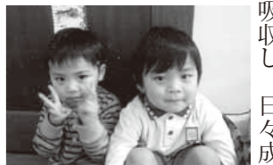
▲とっても仲良い兄弟!!

子どもは、家庭や幼稚園で多くのことを吸収し、日々成長していきます。子育てをしていくと、子どもから教えられたり、気付かされることもたくさんあります。私たちも親になって4年...。分らないことを信じて、見守り、共に成長していけたらと思います。