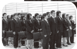
▲初々しい新入学生の皆さん