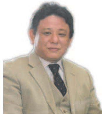
瀧口 達也 氏(新橋)

平成24年度から御殿場市副市長に就任した瀧口達也氏は、勝亦福太郎副市長とともに市長を支えている。