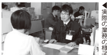
▲実際の業務の様子

式で市長は、「民間の豊富なノウハウと、行政サービスとの効果的な融合によって、更なる安定経営の確立と市民サービスの向上に期待しています。」と挨拶をしました。