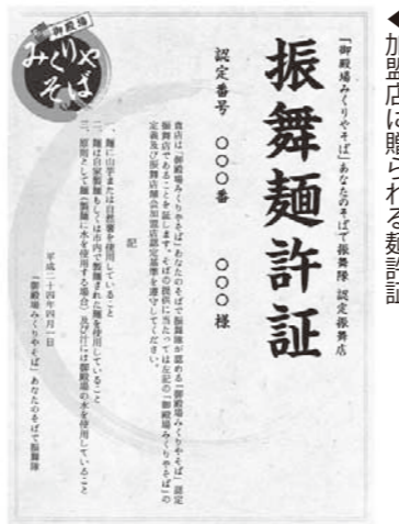
▲加盟店に贈られる麺許証