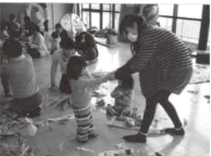
▲楽しみながら学べる遊びがいっぱい!

毎月15日(8月は除く)森之腰中央公民館2階ホールを会場に、午前10時から11時30分までの間、開催しています。