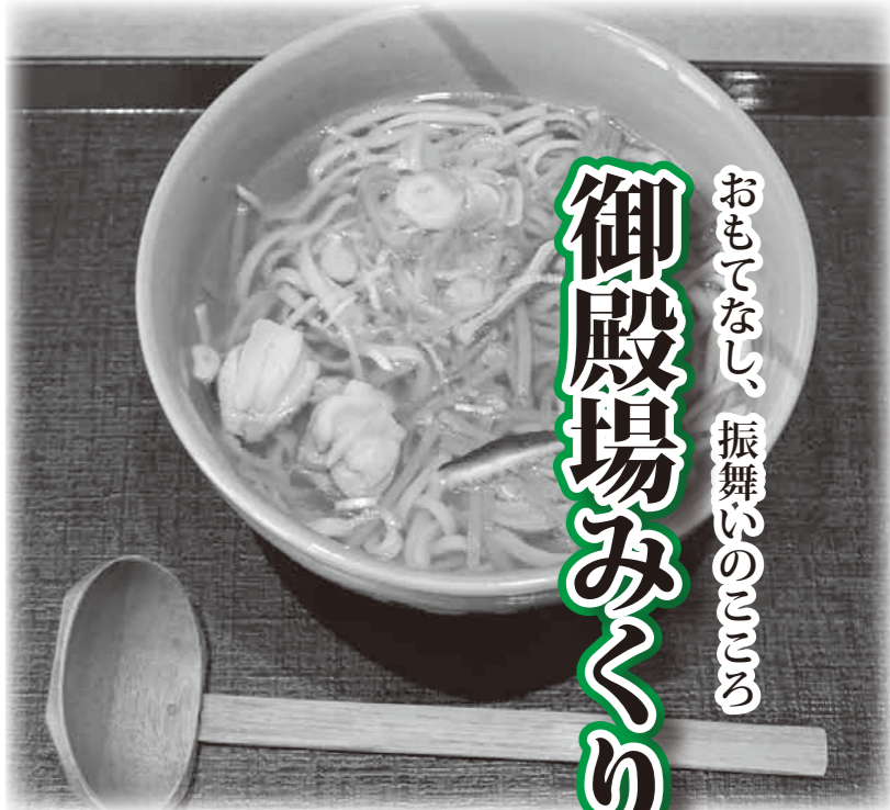
おもてなし、振舞隊のこだわり

ホームページにも「御殿場みくりやそば」の最新情報が満載! http://gotemba-mikuriyasoba.com