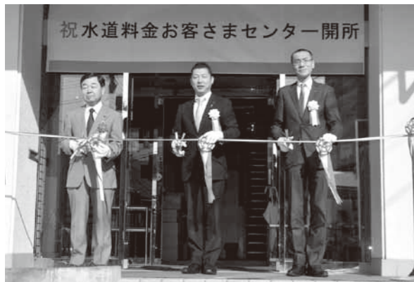
▲左から勝亦市議会議長、若林市長、深澤(株)ジェネッツ代表取締役