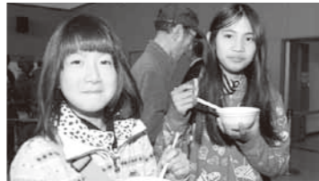
▲今年3月に開かれた「みくりやそば味自慢大会」の様子

各種のイベント等に参加 振舞隊では、「我が家のみくりやそば」味自慢大会をはじめとした振舞隊主催のイベントの開催や、市内外で行われるグルメイベント等にも積極的に参加していきます。5月19日(土)、20日(日)に袋井市のエコパスタジアムで開催される「B級ご当地グルメスタジアムinエコパ」に出店します。また振舞隊の「パンフレット」、「ホームページ」も作成しました。