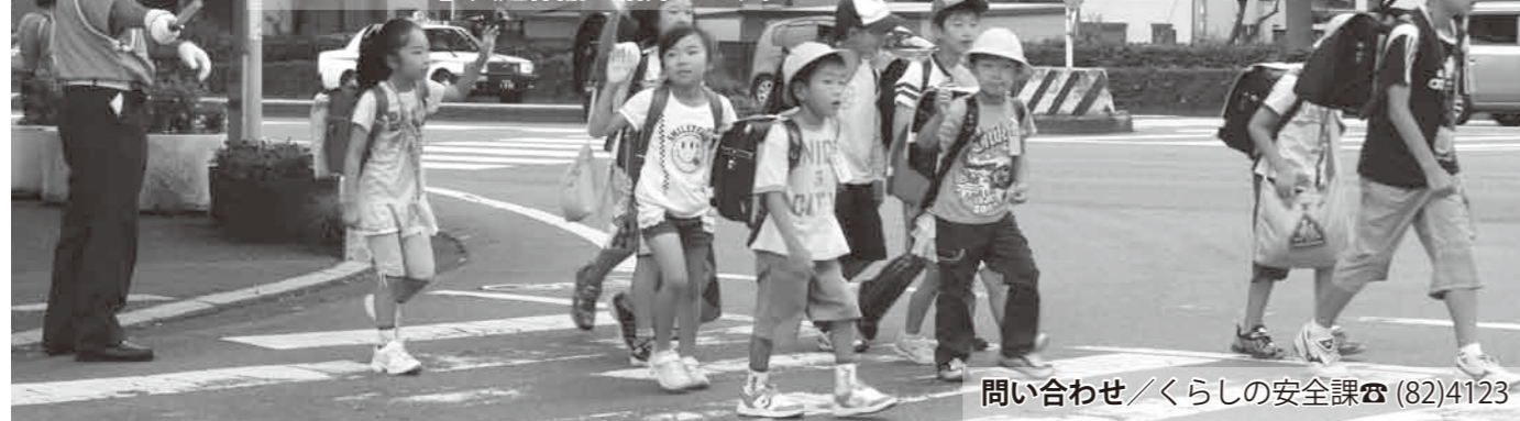
問い合わせ／くらしの安全課 ☎(82)4123

ここでは、新たに任命された8人を含む49人の交通指導員と、第19回「交通安全スローガンコンクール」入選作品を紹介します。