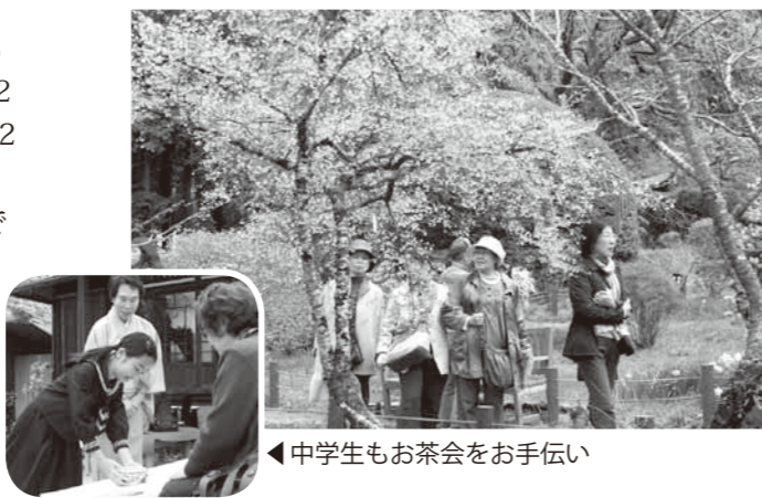
▲桜が咲き誇る園内を散策

日没後以降に行われた夜桜ライトアップでは、ライトに照らされた桜が、幻想的な雰囲気を醸し出し、昼間とはまた違った姿を見せていました。