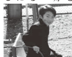
▲お絵描きが大好き!

最近、絵を描くことが好きな息子は、上手に描けると嬉しそうにプレゼントしてくれます。