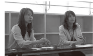
▲子育てのことならなんでもご相談ください!

「業」として、赤ちゃんが生まれたお宅の全戸訪問を目指しています。この事業では赤ちゃんの健やかな成長と育児支援のために保健師・助産師・看護師がお宅に伺い、赤ちゃんの健康や育児に関する不安や悩みなどのご相談に応じています。また、今後の健診や予防接種のご案内、子育て支援の情報提供なども行っています。どんな小さなことでも一人で悩まずにご相談ください。そして、かわいい赤ちゃんの子育てライフを一緒に楽しみましょう!