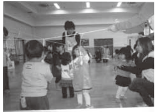
▲子どもたちの明るい声があふれるホール

「みなさん、こんにちは。」明るく笑顔と元気いっぱい挨拶が始まる子育てサロン「子鹿ファミリー」は、親子の集いの場として平成18年に開設され、6年目を迎えました。