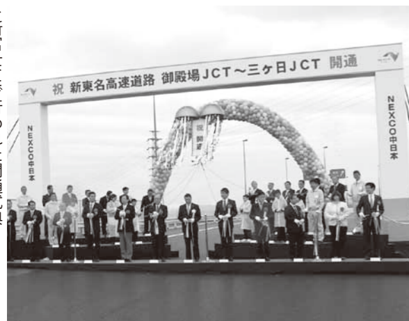
▲新富士ICで行われた開通式典