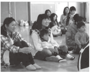
▲お母さんたちの憩いの場所にもなっています

また、子育て中のお母さんたちが、いい状態で子育てができるような、情報交換の場にもなっています。