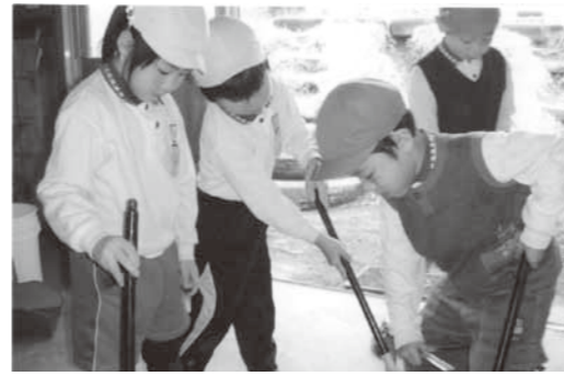
▲今日からぼくは、優しいお兄さん！