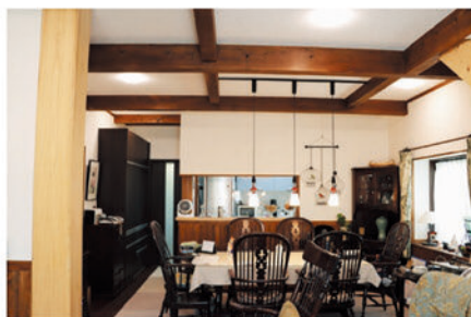
大黒柱・太い梁組・珪藻土壁・ムクの床板