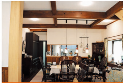
大黒柱・太い梁組・珪藻土壁・ムクの床板