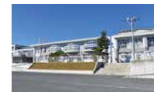
御殿場市立原里小学校