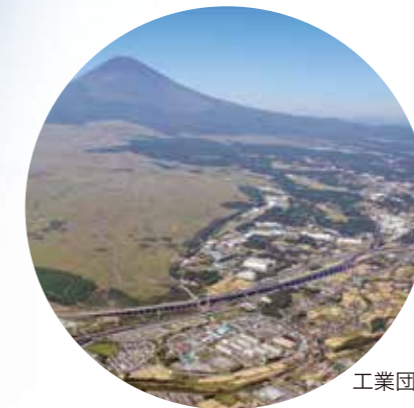
工業団地付近上空

富士山が育んだ素晴らしい環境と首都圏からの抜群の交通アクセスの良さ、充実した補助制度などの要因により、多くの優良企業が御殿場市内で操業しております。働く場所の提供も常に心がけています。