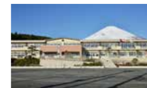
御殿場市立印野小学校